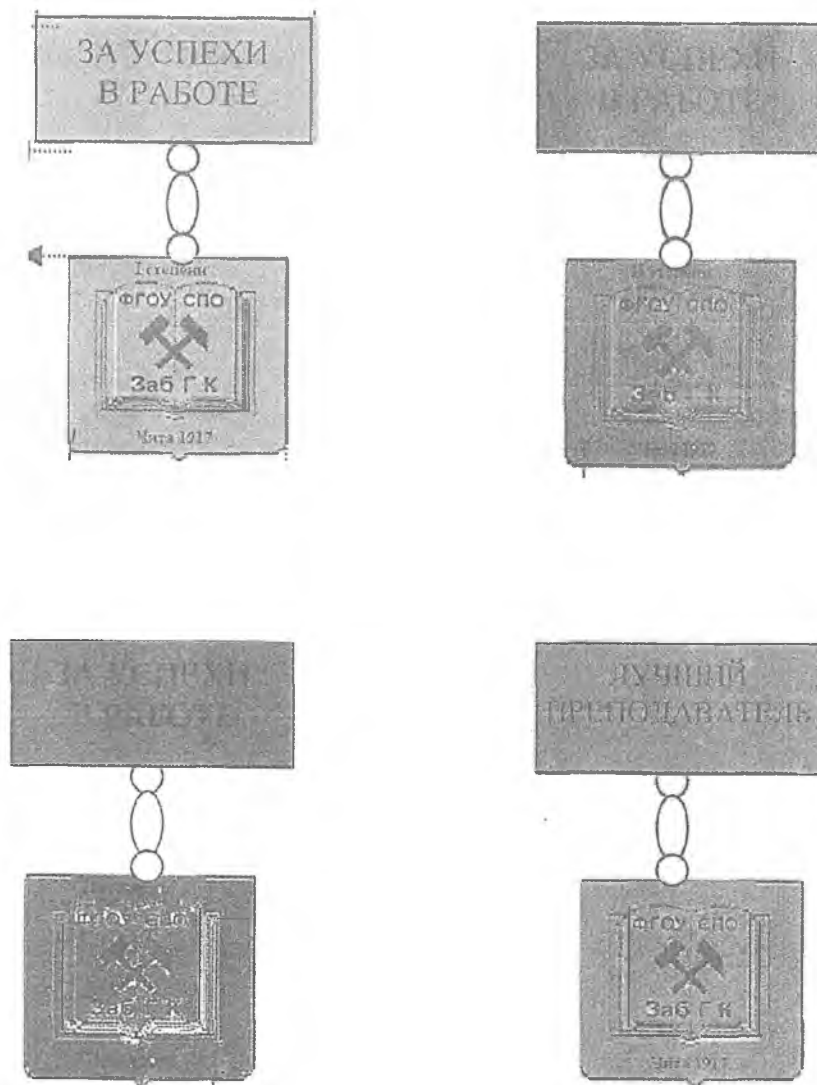
Рис. 1 Нагрудные знаки для работников Учреждения